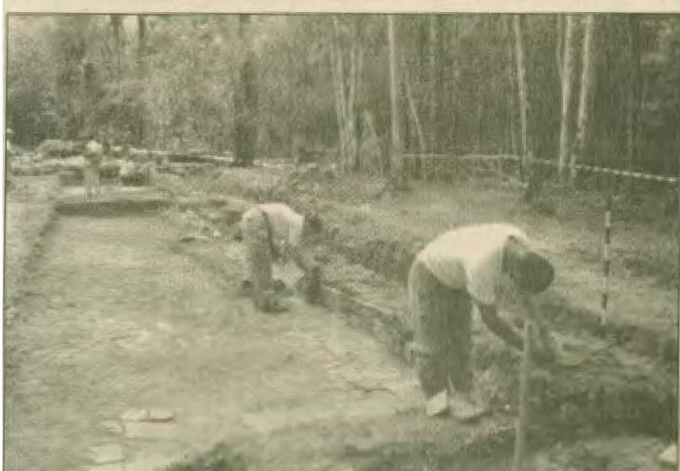
Novas estruturas aparecem reforçando a hipótese de se tratar de uma unidade religiosa.

As escavações no local foram solicitadas pelo Iphan (Instituto do Patrimônio Histórico e Artístico Nacional) e bancadas pelo atual governo amapaense. O valor das escavações está estimado em aproximadamente R$ 600 mil. (Texto extraído da revista Vanguarda Cultural, edição de julho/2005)